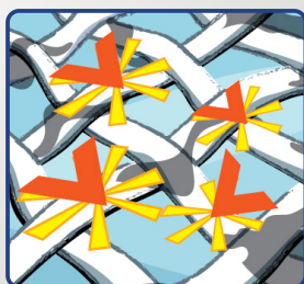
...a štěpí je na menší části.