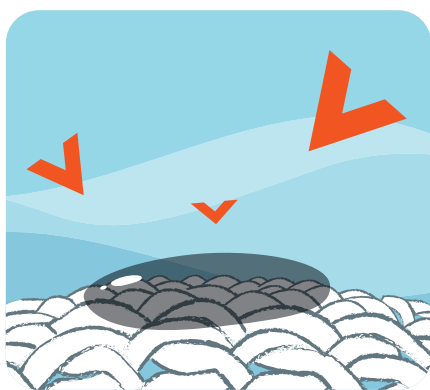
Enzym působí na skvrny

Vysoce účinné složky, které skvěle odstraňují skvrny a čistí i nejdolnější profesní skvrny.