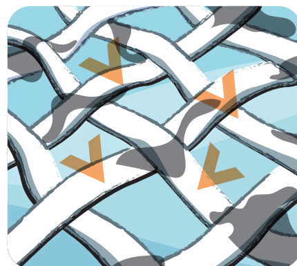
Multipolymerový systém chrání různé typy tkanin před opětovným usazováním nečistot během praní.